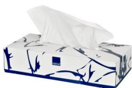
Mouchoirs en papier Réf : 6210

Abena-Frantex SA 5 rue Thomas Edison 60180 Nogent-sur-Oise